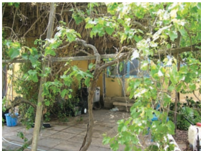
פינה מוצלת מתחת לסוכת גפנים