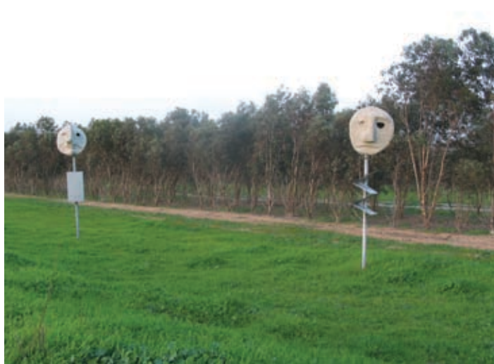
פסלי ראשים השומרים על הדרך המובילה לבית

משני צידי השביל צמחייה עשירה. טלמון (דרוזנטמום) הצובע בוורוד עז את כל האזור