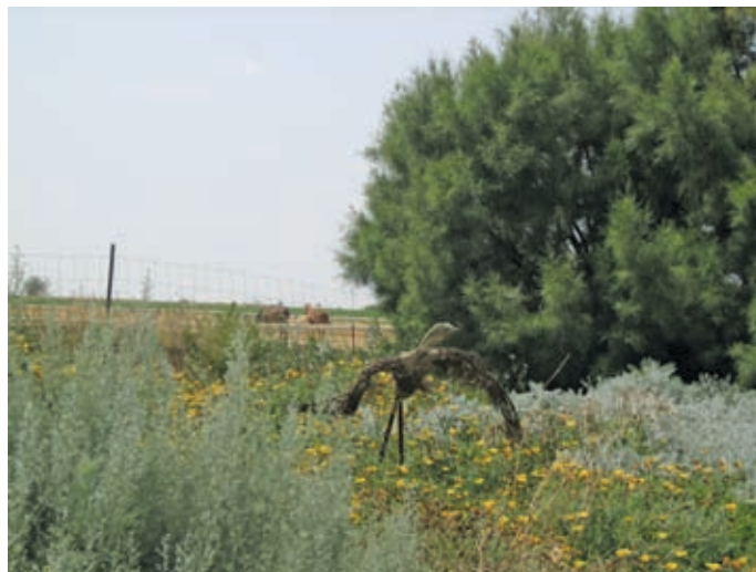
הנוף פורץ לתחום הגן ועל רקע הצמחים פסל ציפור עשוי מענפים