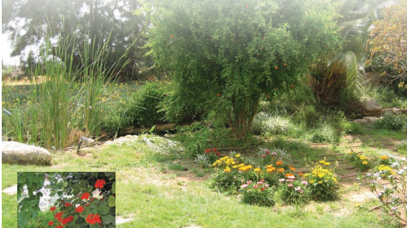
למעלה: עץ רימון רב גזעי נטוע על שפת ה'ינחל'; משמאל: גרניום זקוף באדום עז פורח במשך האביב עד סוף הקיץ

הבית משקיף על בריכת שחייה בעלת קווים מעוגלים. באזור חם ויבש כזה הערך של הבריכה הוא רב מאד והשימוש בה הוא