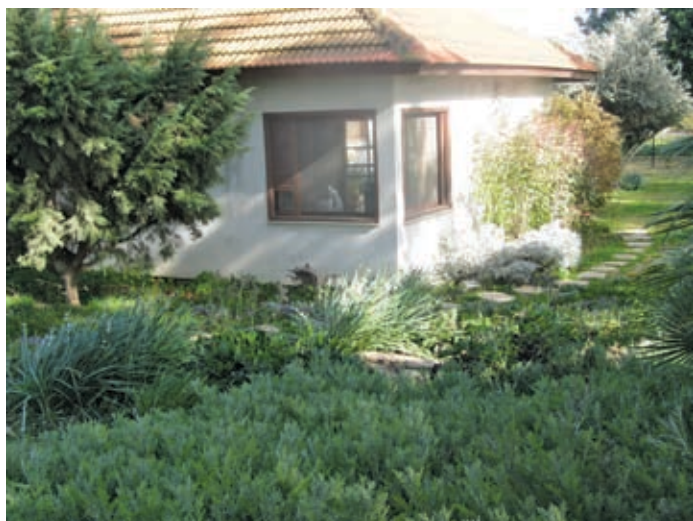
הבית עטוף בצמחיה המצננת את חדרי הבית בקיץ