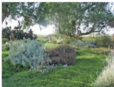
צמחי כיסוי גדלים בהצלחה מתחת לאשלים

המודעות לחסכון במים היא רבה, ולעומת גינות פרטיות במושבים רבים, בהן רוב השטח המגונן הוא מדשאה, כאן הדשא מצומצם יחסית ומצוי רק באזור שנועד למשחקי הילדים ולאירוח. בקיץ הדשא מושקה בכמויות העוזרות לו לשרוד ורוב הקיץ צבעו נוטה לצהבהב, אבל הוא חי וממזג את האוויר והאווירה.